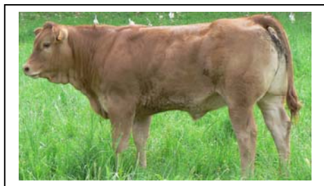
FILLE DE REVEUSE